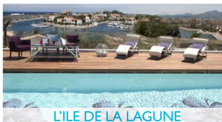
L'ILE DE LA LAGUNE

Hôtel***** Spa ■ Marrakech Situé dans la palmeraie et entouré des principaux golfs de Marrakech, le Domaine des Remparts, véritable havre de paix, se dessine au centre d'un jardin de deux hectares s'ouvrant sur une vue imprenable sur le Haut Atlas. S'inspirant de l'esprit des ksars berbères et d'un décor contemporain enrichi d'une touche d'artisanat, les 32 suites et les deux pavillons possèdent tous un jardin verdoyant. Joyau de l'hôtel, l'immense piscine et le superbe Spa permettent à chacun de se détendre dans une ambiance intimiste. • www.domainedesremparts.com