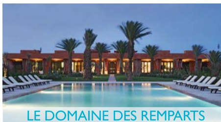
LE DOMAINE DES REMPARTS