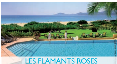
LES FLAMANTS ROSES

ROUSSILLHÔTEL Roussillhôtel est un groupe familial constitué de 11 hôtels de 2 à 5 étoiles, tous basés en Languedoc-Roussillon à l'exception du Domaine des Remparts à Marrakech. Dans le sud de la France, de Collioure à Sète en passant par Argelès-sur-Mer, Canet-en-Roussillon et Saint-Cyprien, Roussillhôtel propose une offre Thalasso, des Spas, un golf 27 trous et des tables gastronomiques. Ces 11 hôtels offrent toute la chaleur, la convivialité et le charme de la Méditerranée, associés à l'ambiance chaleureuse et familiale assurée par la famille Lormand. • www.roussillhotel.com