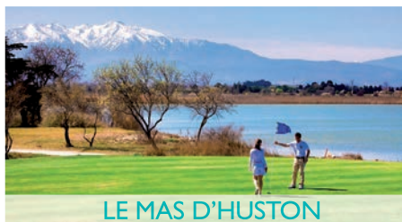
LE MAS D'HUSTON